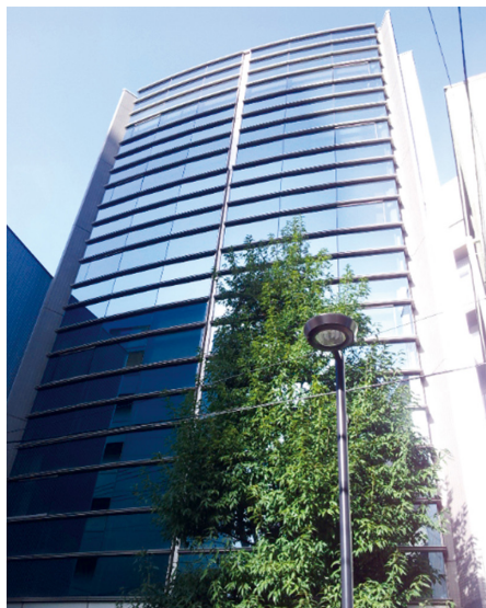
原一探偵事務所 仙台支社 宮城県仙台市青葉区本町 2-6-154 階 地下鉄南北線「広瀬通」駅から徒歩 1 分

仙台には小さな歌舞伎町といわれる国分町があり、危険に遭遇する調査も少なくありません。張り込み中に支障があることも珍しくないそうですが、仙台支社の調査員は見事に問題を潜り抜け、調査に影響を及ぼしません。社員教育に優れ、経験豊富な調査員が多い原一探偵事務所ならではのテクニックです。