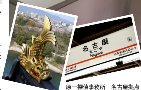
原一探偵事務所 名古屋拠点 愛知県名古屋市中区大須 1-21-20 2F 名古屋市営地下鉄鶴舞線「大須観音」駅から徒歩1分