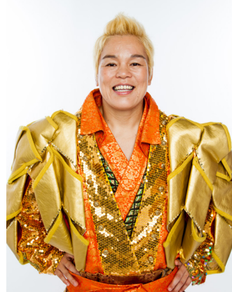
かんどりしのぶ 神取忍

プロレスラー。株式会社LLPW-X代表取締役社長。2004年参議院選挙出馬（比例代表/自由民主党）。子ども達はいじめ問題に精力的に活動。テレビ・雑誌などマスコミ出演多数。