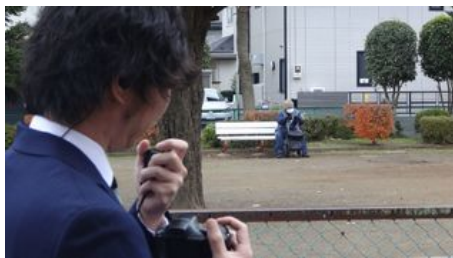
高齢者は予期せぬ行動をとる場合も(当社で行った実際の見守り調査の様子)