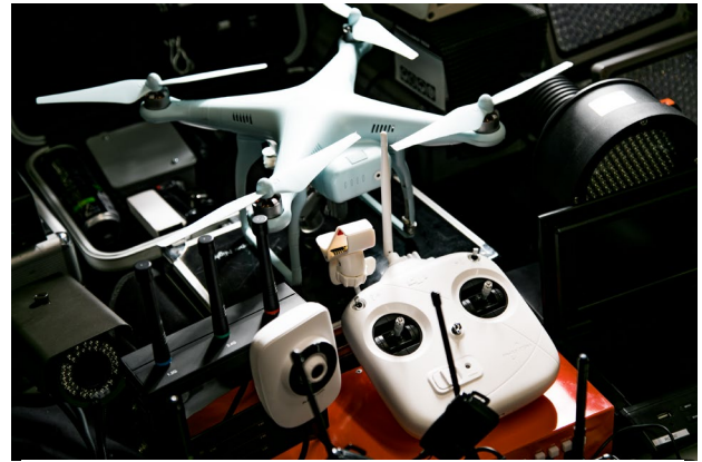
人が入っていけないところではドローンを使用することも